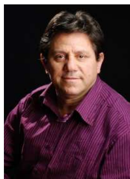
Lenio Vallati Penna Blu 2009